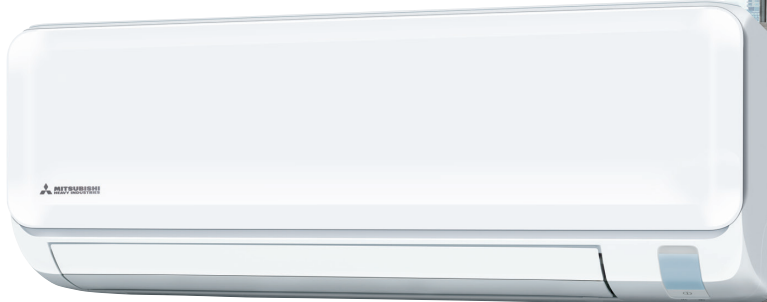
SRK15ZTL-W, SRK20ZTL-W, SRK25ZTL-W, SRK35ZTL-W, SRK50ZTL-W