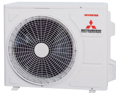
SRC15ZTL-W, SRC20ZTL-W, SRC25ZTL-W, SRC35ZTL-W